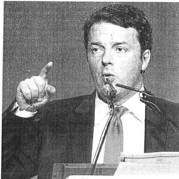
Il premier Matteo Renzi

Niente contributi per i neoassunti. Collegata alla riforma del mercato del Lavoro, contenuta nel Jobs act, la decisione di prevedere nella legge di Stabilità «incentivi che permetteranno per un triennio di non pagare contributi a chi fa assunzioni a tempo indeterminato. Togliamo - ha proseguito Renzi - per i nuovi assunti l'articolo 18 e togliamo il peso fiscale per i primi tre anni. Coloro i quali nel 2015 assumeranno giovani e meno giovani a tempo indeterminato avranno la possibilità di non pagare i contributi e lo Stato si sostituirà all'imprenditore nel pagamento, ha spiegato il premier, precisando che l'agevolazione scatterà per gli assunti dal primo gennaio al 31 dicembre 2015. Un altro miliardo e mezzo di euro, inoltre, dovrebbe andare a fi-